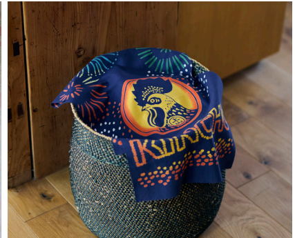
金鳥の夏日本の夏 注染てぬぐい 金鳥花火

金鳥の渦巻でおなじみの絵柄を細部まで丁寧に表現。注染ならではの美しい色の混ざりをお楽しみいただけます。