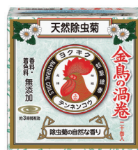
旧デザイン (ミニサイズ)

今回、この特別な商品の新パッケージを、中川政七商店がデザインしました。「天然」というキーワードをもとに、主原料である除虫菊、針葉樹、タブの木、トウモロコシのイラストを四隅に配し、クラフト紙を思わせる自然な色合いでまとめました。天然素材でできていることが、ひと目で伝わるデザインです。