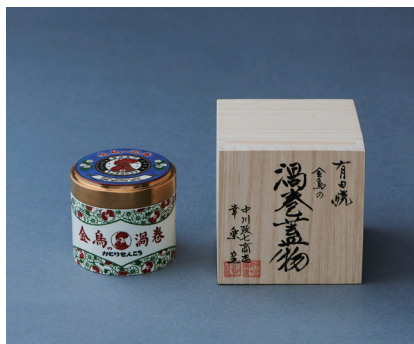
金鳥の夏日本の夏 有田焼 金鳥の渦巻蓋物

金鳥の伝統的なモチーフを大胆に使い、蚊取り線香の煙を注染のぼかしをいかして表現しました。