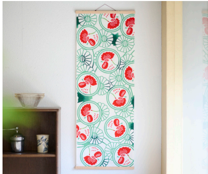
金鳥の夏日本の夏 注染てぬぐい 金鳥紋

明治時代から戦前まで製造されていた、棒状蚊取り線香「金鳥香」の昔のパッケージを再現しました。