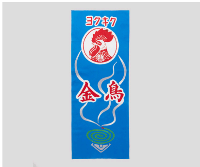
金鳥の夏日本の夏 注染てぬぐい 金鳥看板

明治時代から現代まで使われてきた蚊取り道具と、中川政七商店にゆかりのある蚊帳をちりばめた、にぎやかなデザインです。