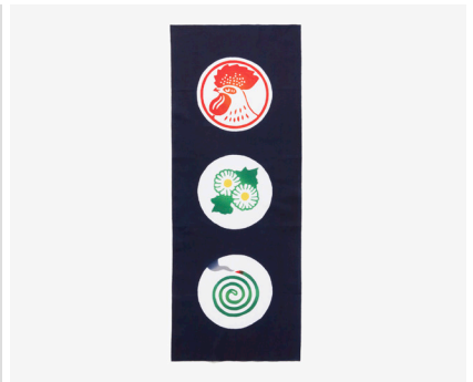
金鳥の夏日本の夏 注染てぬぐい 金鳥丸紋

懐かしいホーロー看板をモチーフに、蚊取り線香の煙のグラデーションなどを注染のぼかしをいかして表現しました。