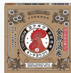
新デザイン (レギュラーサイズ)