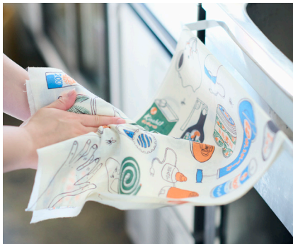
金鳥の夏日本の夏 手捺染てぬぐい 蚊取り道具づくし

お馴染みのCMを彷彿とさせる花火柄。音が聞こえてきそうなほど勢いのある描写と、火花のグラデーションに注目です。