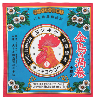
金鳥の夏日本の夏 風呂敷 金鳥の渦巻

長年愛され続ける「金鳥の渦巻」の缶デザインを有田焼で再現。「貴族の遊び」をイメージし、伝統工芸士による手描きの絵付けをもとに高度な転写の技術を贅沢に生かした逸品です。