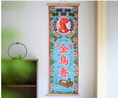
金鳥の夏日本の夏 手捺染てぬぐい 金鳥香