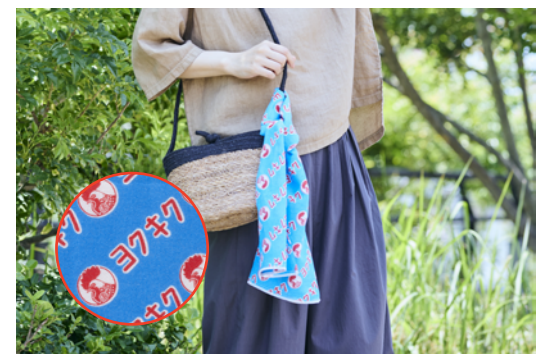
▲「ヨクキク」の4文字がモチーフ