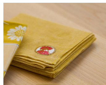
菊染め花ふきん 天然金鳥 税込価格：1,320 円

中川政七商店がパッケージデザインをした「天然除虫菊 金鳥の渦巻」(防除用医薬部外品)と、金鳥の絵柄が浮かぶ瀬戸焼の線香皿を、菊染め手ぬぐいで包みました。