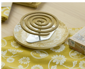
金鳥の渦巻と瀬戸焼の線香皿セット 税込価格：4,070 円

大正時代に発売された当初から、基本的なデザインを変えずに販売されてきた「金鳥の渦巻」。そのパッケージを模した鮮やかな絵柄が特徴の風呂敷です。