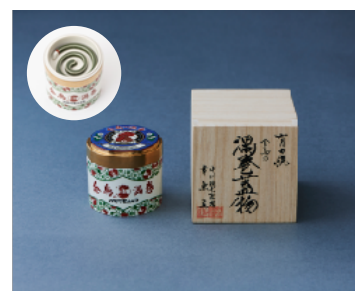
有田焼 金鳥の渦巻蓋物 税込価格：55,000 円

金鳥の伝統的なモチーフを大胆に使い、蚊取り線香の煙を注染のぼかしをいかして表現しました。