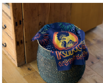
手捺染てぬぐい 金鳥花火 税込価格：1,980 円

金鳥の渦巻でおなじみの絵柄を細部まで丁寧に表現。注染ならではの美しい色の混ざりをお楽しみいただけます。