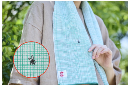
▲「蚊帳の外」に追いやられた蚊。