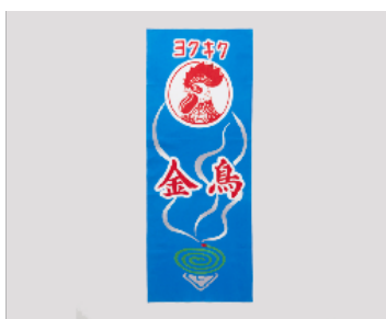
手捺染てぬぐい 金鳥看板 税込価格：1,980 円

大正時代から、基本的なデザインを変えずに販売されてきた「金鳥の渦巻」。そのパッケージを模した鮮やかな絵柄が特徴の風呂敷です。