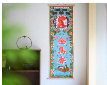
手捺染てぬぐい 金鳥香 税込価格：1,980 円

金鳥の渦巻(蚊取り線香)の成分の一つである除虫菊にちなんだ菊の花で染めた花ふきん。大判なので大きなお皿でもさっと水を吸い取ることができます。