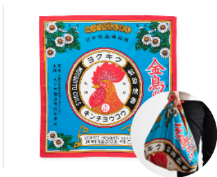
風呂敷 金鳥の渦巻 税込価格：3,300 円

大正時代に発売された当初から、基本的なデザインを変えずに販売されてきた「金鳥の渦巻」。そのパッケージを模した鮮やかな絵柄が特徴の風呂敷です。