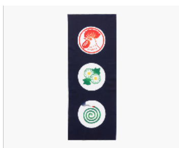
手捺染てぬぐい 金鳥丸紋 税込価格：1,980 円

お馴染みの CM を彷彿とさせる花火柄。音が聞こえてきそうなほど勢いのある描写と、火花のグラデーションに注目です。