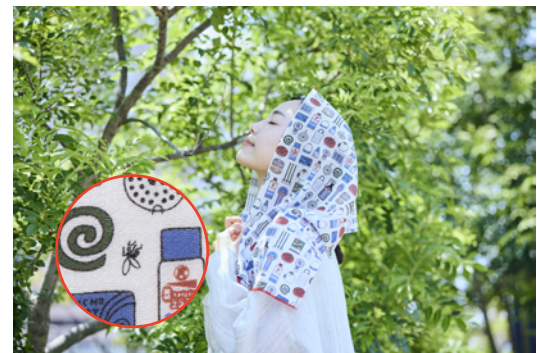
▲「蚊帳り道具」の威力に、ひっくり返った蚊が一匹。